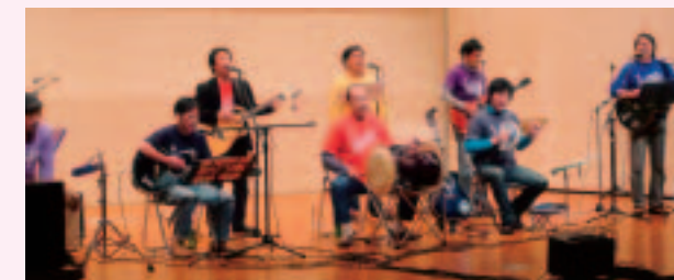
▲心に訴えかけるおやじバンドの演奏

こうした活動は、さらに広がりを見せ、差別のない社会にしていきたいという願いとともに、“おとなが楽しそうに生きていなければ、子どもも楽しいわけがない”というスローガンのもと、日本人と在日韓国・朝鮮人のメンバーが思いを1つにして、歌とメッセージに託し、その思いをより多くの人々にお届けしています。