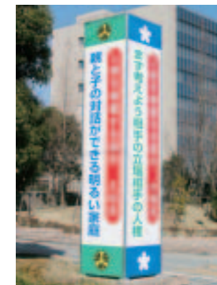
▲イビデン(株)本社に設置された人権啓発広告塔

貴社からは、こうした取り組みの趣旨にご賛同をいただき、設置場所にご協力をいただきました。設置場所は、養老鉄道「西大垣駅」の東にあります本社駐車場の入口です。