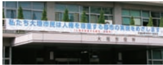
▲市役所入口の人権啓発横断幕

大垣市人権を尊重する都市宣言 平成6年9月21日 人権は、すべての人が自由で平等にいらしていくために生まれながらにして持っている、人間としての権利です。 私たち大垣市民は、人類の多年にわたる努力の成果である人権が、永久に侵されることのないよう、自らの人権意識を高め、すべての市民がかけがえのない存在として互いに尊重しあう、平和で差別のない都市の実現を目指します。 ここに大垣市を「人権を尊重する都市」とすることを宣言します。