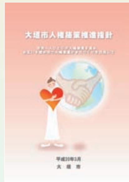
平成20年3月策定の「大垣市人権施策推進指針」

この「人権Letter」では、市からのお知らせや情報の提供だけでなく、広く市民の皆様のお考えやご意見を紹介し、市民の皆様と一緒に人権への関心と理解を深めてまいりたいと存じますので、今後一層のご支援ご協力をお願い申し上げます。