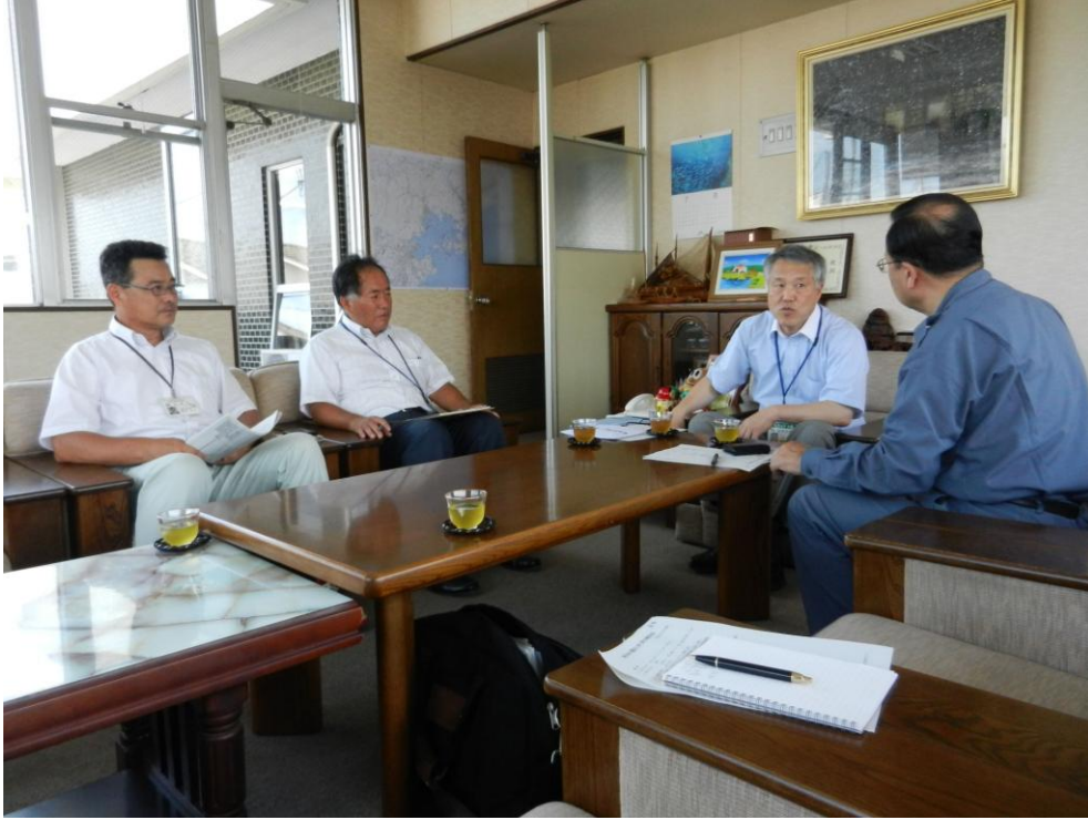
大橋町長（右から2人目）ほか町幹部との面談（松島町）