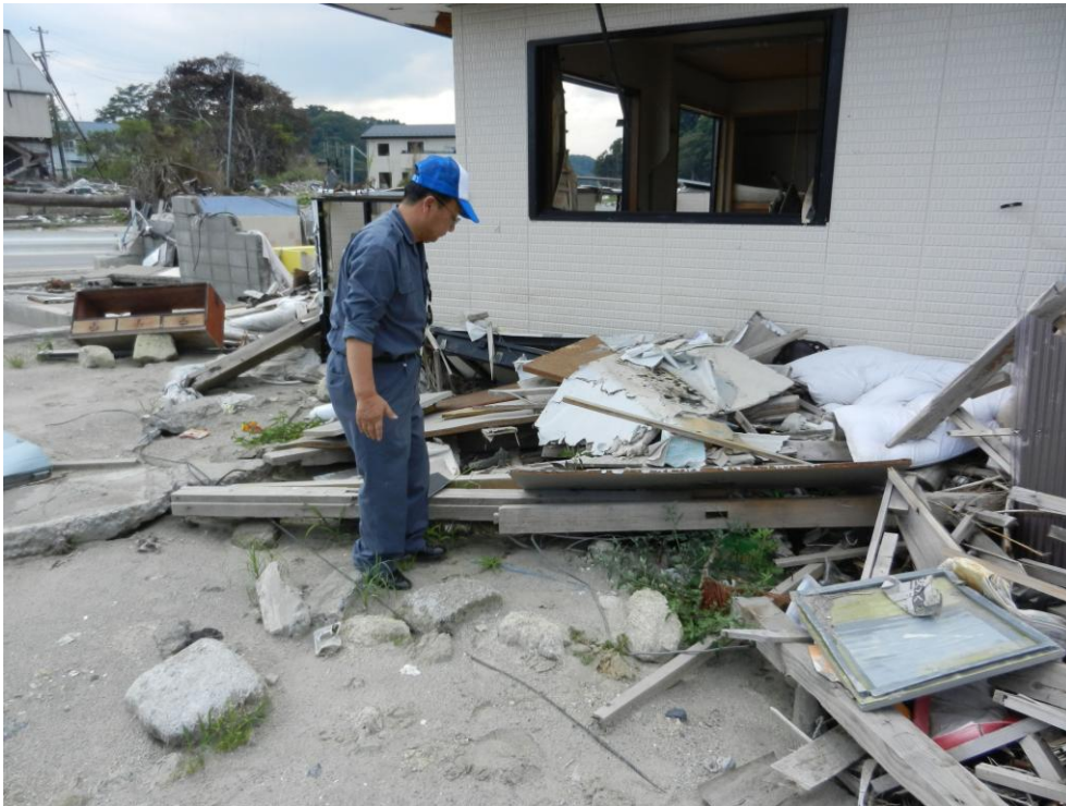
がれきが残る宮戸島の被災現場（東松島市）