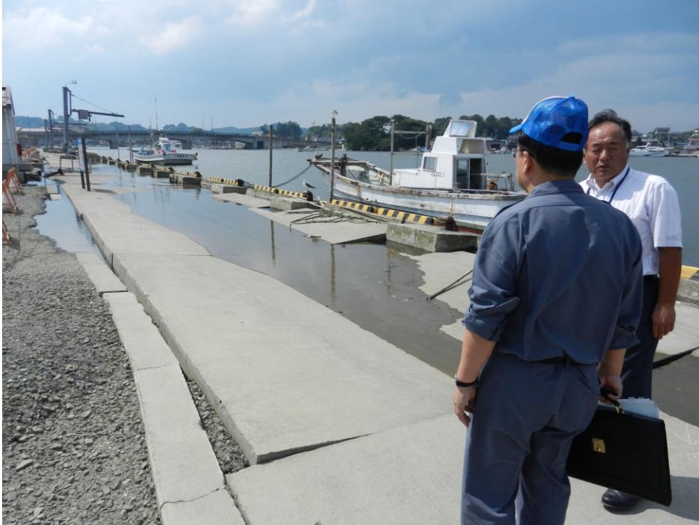
漁業協同組合磯崎協同かき生産工場周辺の被災現場（松島町）