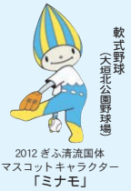
2012ぎふ清流国体 マスコットキャラクター「ミナモ」