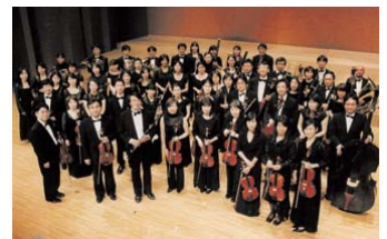
大垣市室内管弦楽団

＊入場券／1,000円(全自由席で、スイトピアセンター1階の事務室で販売) ※未就学児の入場はできません 詳しくは、文化振興課(内線784)でお尋ねください。