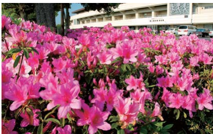
浅中公園に咲くツツジ(昨年)