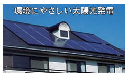
環境にやさしい太陽光発電

置者に還元されることで、太陽光発電をより一層普及推進し、エネルギーの地産地消による環境保全の輪を広げていきます。