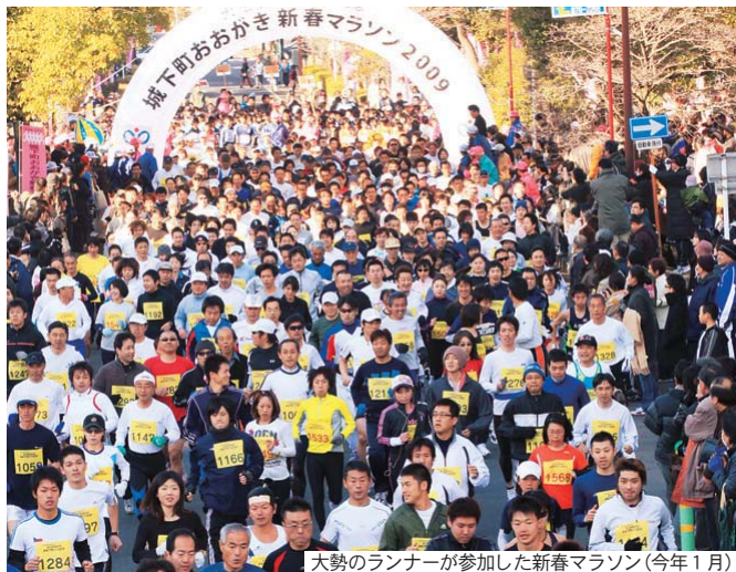
大勢のランナーが参加した新春マラソン(今年1月)

詳しくは、同実行委員会事務局(商工観光課内 内線517)または、専用ホームページ(http://www.joukamachiogaki-marason.jp/)をご覧ください。