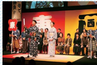
昨年の東西全国俳句相撲

*申し込み/郵便番号・住所・氏名・電話番号・整理券必要枚数を記入し、郵送またはファクスで、実行委員会事務局(社会教育スポーツ課「東西全国俳句相撲係」、〒503-0888 丸の内2-55、FAX81-0715)へ(電話または専用ホームページから申し込み可) ※配布枚数に達した場合は、配布終了