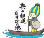
奥の細道 むすびの地