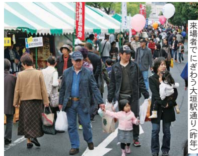
来場者でにぎわう大垣駅通り(昨年)

産業フェスティバル実行委員会は、「芭蕉元祿祭市・祭座 西濃・まるごとパザール・インおおがき」を、11月21日(土)・22日(日)の両日、大垣駅通り一帯で開催します。特産品販売やステージイベントなど楽しい催し盛りだくさん。ご家族おそろいでご来場ください。詳しくは、同実行委員会(大垣市観光協会内 ☎77-1535)へ。