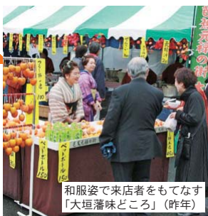
和服姿で来店者をもてなす「大垣藩味どころ」(昨年)

【21・22日】午前10時～午後4時＝新大橋一帯 【内容】芭蕉元祿をキーワードにした和菓子やいなりずし、地酒や木ますなどの大垣の特産品の販売