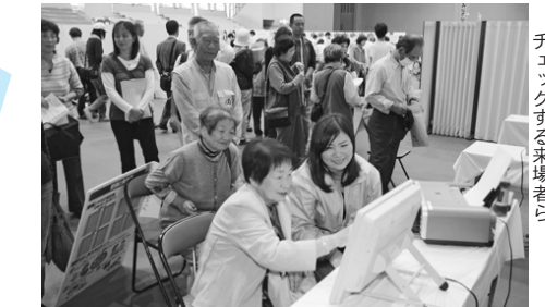
機材を使って、自分の健康をチェックする来場者ら

「市民の健康広場」が10月18日、大垣城ホールで開かれ、多くの家族連れらでにぎわいました。会場では、医師による相談や健診、体力測定など健康に関する多彩な催しが開かれ、訪れた多くの皆さんが、自分の健康状態を確認し、今後の健康づくりのきっかけとしていました。