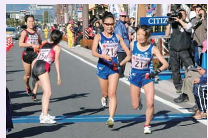
第3中継所(昨年の大会)