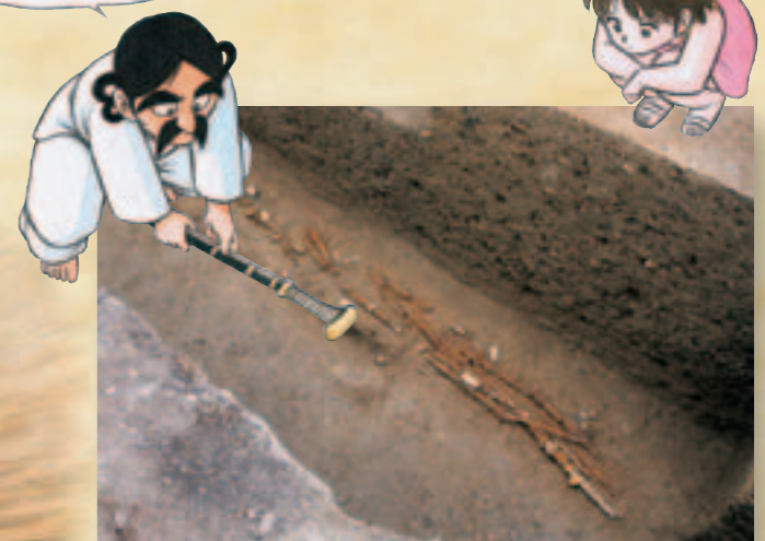
▲出土した鉄剣や鉄刀など