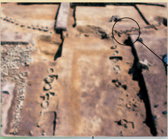
▲前方部から後円部へ つづく埴輪の列