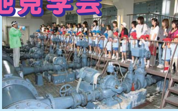
ポンプ室を見学する参加者（昨年の様子）

市は、6月1日からの「水道週間」に合わせ、北部水源地（興福地町2）を一般開放します。