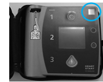
インジケータの位置(機種によって異なります)

さまざまな場所にAED(自動体外式除細動器)が設置され、尊い命が救われている一方、バッテリー切れや不具合などによりAEDが正常に作動しなかった事例も報告されています。AEDが正常かどうかを示すインジケータの確認や、使用期限がある電極パッドやバッテリーの交換を定期的に行いましょう。