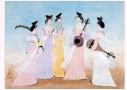
初公開の「天平の楽人」