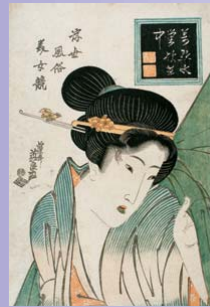
浮世絵美人画展 漢齋英泉 《浮世風俗美女競》