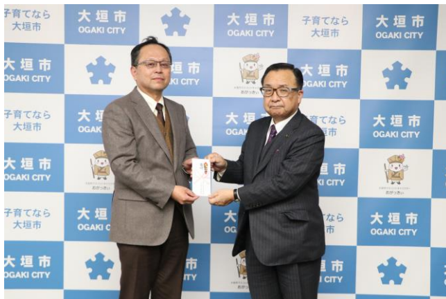
16:30～ 第30回大垣市少年スポーツ賞授与式