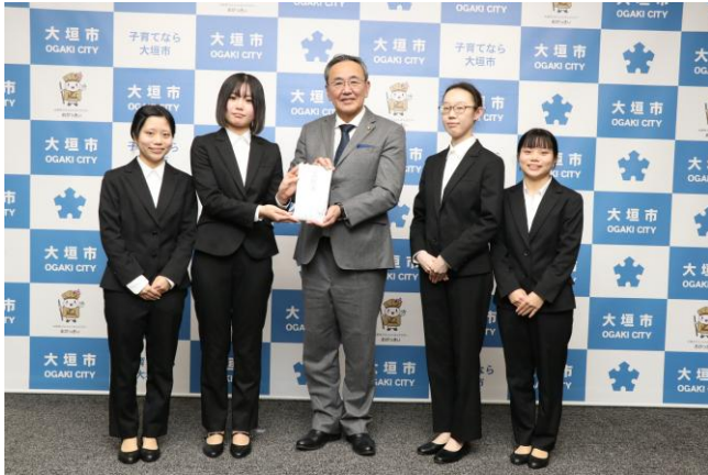
大垣女子短期大学学友会の皆様と