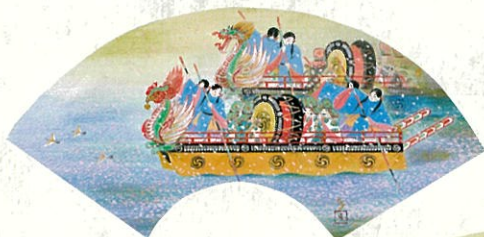
源氏物語 胡蝶「龍頭錦首」