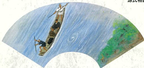
扇面芭蕉 五月雨を集めて早し最上川