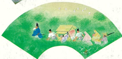
源氏物語 常夏「夏野をゆく」