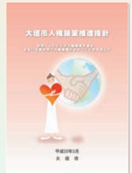
平成20年3月策定の「大垣市人権施策推進指針」

この「人権Letter」では、市からのお知らせや情報の提供だけでなく、広く市民の皆様のおみやご意見を紹介し、市民の皆様と一緒に人権への関心と理解を深めてまいりたいと存じますので、今後一層のご支援ご協力をお願い申し上げます。