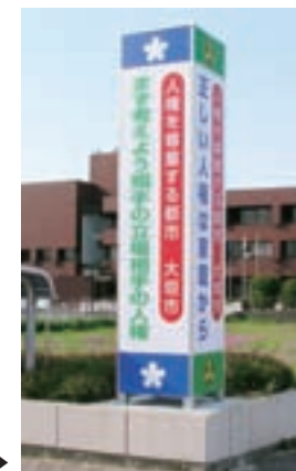
墨保さくら会館の広告塔▶

市は、市民が人権に関心を持ち、人権意識を高めることを目的に「人権啓発広告塔」を平成9年から毎年設置しています。 広告塔は、多くの皆さんに人権意識を会得していただくよう、4面体のそれぞれに啓発標語を載せて、主要道路や公園・公共施設といった多くの人が目に触れる場所に設置をしています。 現在は、市内全域に15か所設置しており、今年度も16か所目の設置を検討しています。