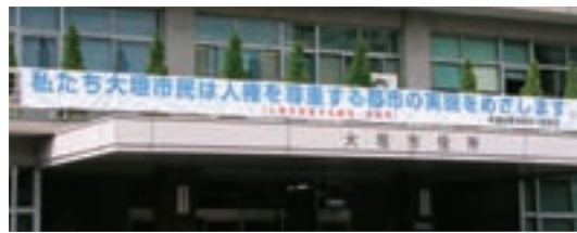
▲市役所入口の人権啓発横断幕

大垣市人権を尊重する都市宣言 平成6年9月21日 人権は、すべての人が自由で平等にいらしていただくために生まれながらにして持っている、人間としての権利です。 私たち大垣市民は、人類の多年にわたる努力の成果である人権が、永久に侵されることのないよう、自らの人権意識を高め、すべての市民がかけがえのない存在として互いに尊重しあう、平和で差別のない都市の実現を目指します。 ここに大垣市を「人権を尊重する都市」とすることを宣言します。