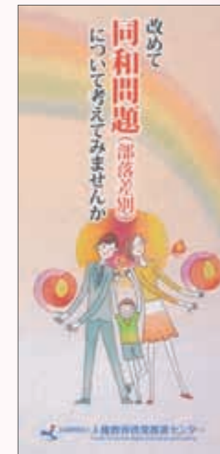
「部落差別解消推進法」 啓発リーフレット

残念ながら、今なお、こうした人々に対して、結婚や就職などにおける差別、差別につながる身元調査が行われたり、インターネット上で差別を助長するような内容の書き込みなどの問題が発生しています。また、同和問題を口実に、企業や行政機関などへ不当な圧力をかけ高額の本を売りつけたり、寄附金などを強要する「えせ同和行為」は、同和地区出身者等に対する偏見を助長し、同和問題の解決をはばむ大きな要因となっており、排除していかなければなりません。