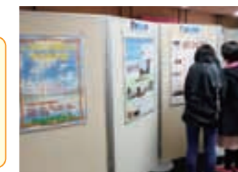
図書館での展示の様子