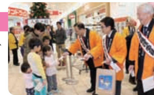
一日人権擁護委員による街頭啓発

当日、一日人権擁護委員として、大垣市長、大垣市会議長、大垣市教育長の計3名が委嘱され、人権擁護委員の皆さんや「人KENまもる君」「人KENあゆみちゃん」などと一緒に、多くの市民の方に人権啓発のチラシや啓発物品を配布し、人権を尊重する意識の普及・高揚を呼びかけました。