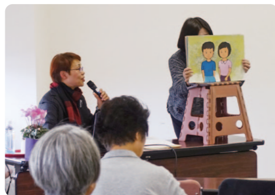
性的少数者の人権問題を解説される三尾講師