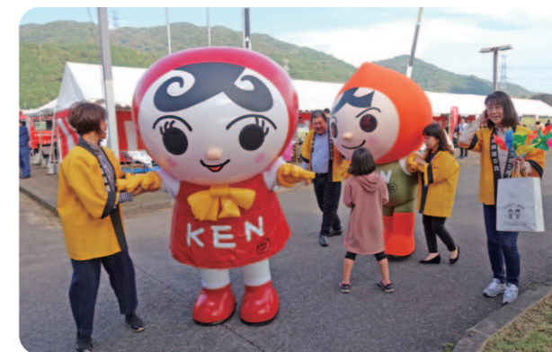
人KENあゆみちゃんの人KENまもる君