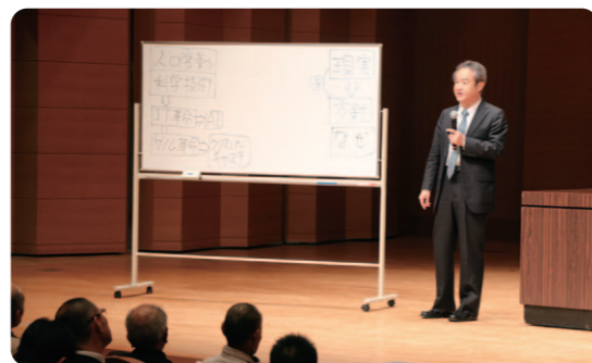
ネットリテラシー向上を訴えられる北口講師