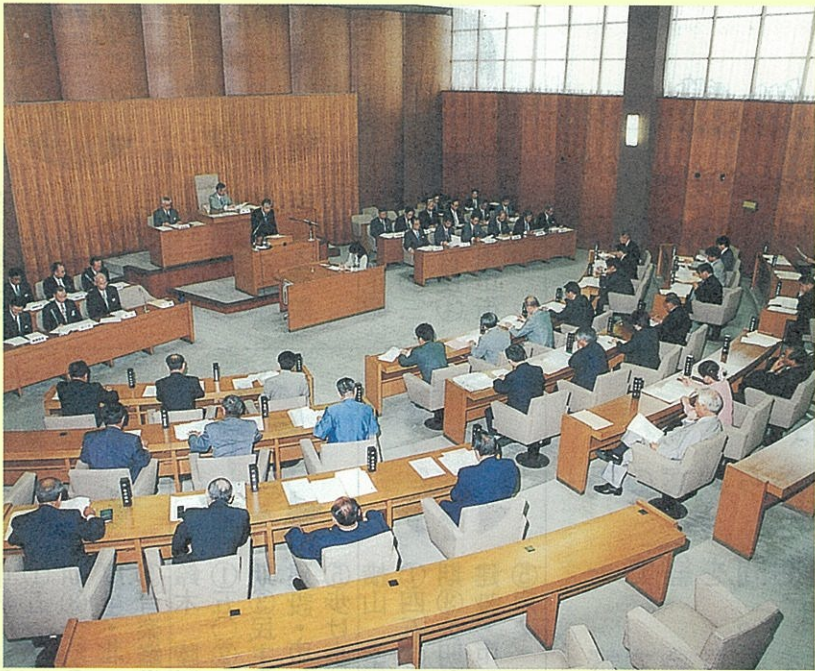
定例会本会議風景

このたび、「大垣市議会だより」を発刊する運びとなりました。 八十年余の伝統と歴史を誇る大垣市議会の記念すべき創刊号であります。 国・地方を問わず、行政改革が実施される中、議会も市民に開かれた議会を目指して、その改革に鋭意、協議、検討を重ねてまいりました。 この議会改革の一つとして、試行錯誤を繰り返しながら、