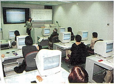
情報工房のパソコン研修

市においても、幅広く市民の皆様の要望にこたえるため、IT講習推進事業を積極的に活用し、情報工房だけではなく、小中学校のパソコン教室、社会教育施設等で講習会を開催するなど、受講場所や受講人数の拡大に努めたい。