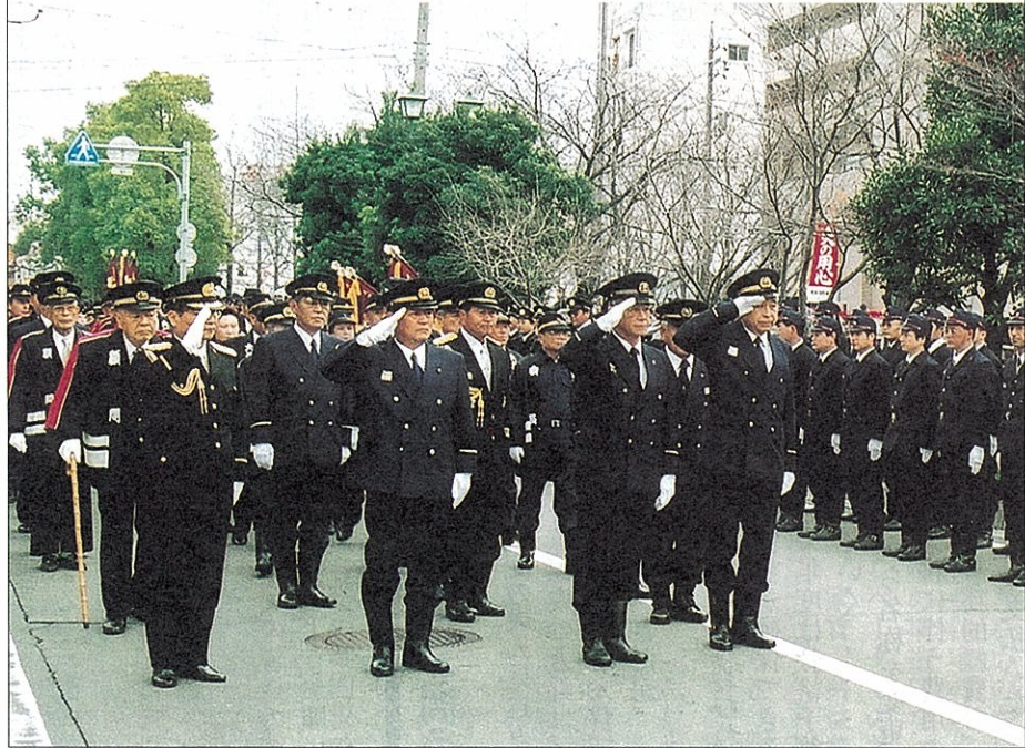
消防団員らを閲閲する消防関係者

総務費では、住民訴訟の当事者となった職員の勝訴が確定したことにより、訴訟に係る費用二百四十万円を補助、今年四月に予定される市長選挙の準備事務費六百七十万円、及びポスター掲示場設置経費として債務負担行為百七十四万円を設定。 民生費では、老人福祉医療支給事業における受給資格者の一部負担導入の実施時期の遅れによる予算不足額七千六百二十万円を、介護保険サービスに関連して、低所得者のホームヘルプサービス等の利用負担を軽減す