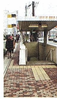
市民病院前地下横断通路

庁舎内に総合窓口の案内図、エレベーター誘導標識板等を設置して案内をしているが、来庁者により分かりやすくするため、エレベーターの誘導標識板及びエレベーター室内に各階の案内板の設置を要望する。エレベーター前、廊下の上に出すべきではないか。また、エレベーター内に案内板の設置などバリアフリーの推進を要望する。