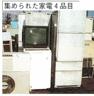
集められた家電4品目

不法投棄をなくすためには、限りある資源を有効に再利用するため、このリサイクルルートを活用していただくよう、広報やチラシ等をおしてPRする。さらに、現在の大型ごみのステーション方式による回収では、不法投棄がふえることも考えられ、大型ごみの収集方法を見直し、電話予約による個別収集を取り入れた有料化を検討したい。