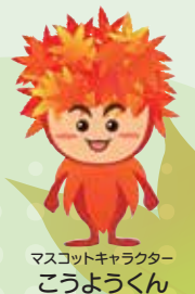
マスコットキャラクター こうようくん

冬には白と黒の水墨画の世界に つつまれ、一年を通じてその時々 の自然の美しさを楽しむことができます。