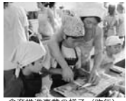
食育推進事業の様子(昨年)