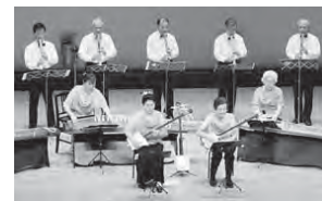
第1回(昨年6月)の様子