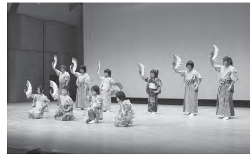
日ごろの成果を披露した「地域子ども活動発表会」

「スイトピア子どもまつり」が2月18日・19日の両日、スイトピアセンターで開かれました。市と市教育委員会・市民団体などが協力して、親子で楽しめる12のイ