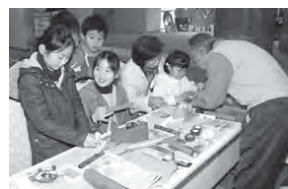
万華鏡づくり体験コーナー