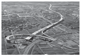
大垣西IC(仮称)から南を望む

▷内容/高架橋の上から見て(全4回・事前申込可)や、工事概要・建設機械の展示など 申込方法など詳しくは、岐阜国道事務所「東海環状現場見学会」係(☎058-271-9815、 http://www.cbr.mlit.go.jp/gifu/ )へ。