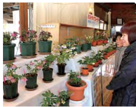
さまざまな品種が展示される会場(昨年の様子)