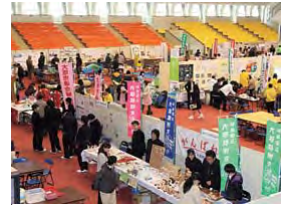
さまざまな団体のブースが並ぶ会場(昨年の様子)