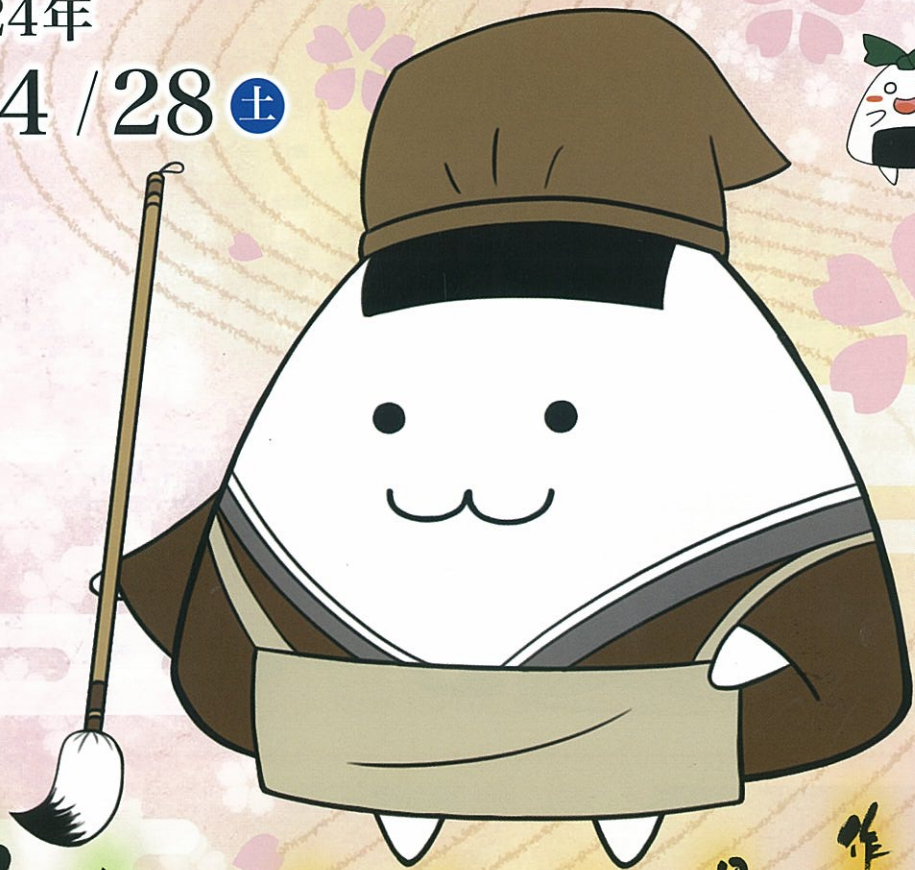
マスコットキャラクター むすぶくん