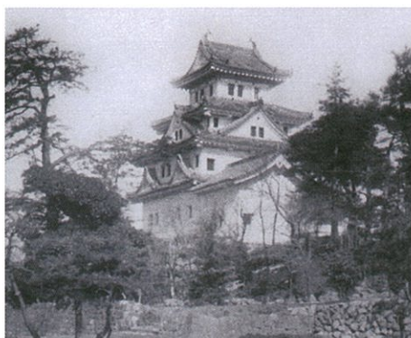
戦前の大垣城

注: 展示資料は変更される場合があります。 作品保護のため、一部資料を会期中、展示替えいたします。