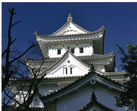
平成22年改修後の大垣城