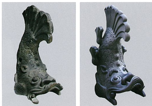
乾隅櫓のものと言われる鯨瓦(左)と復元された鯨瓦(右)