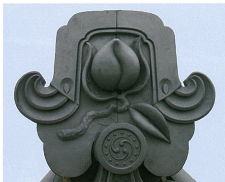
復元された鬼瓦(桃の意匠)