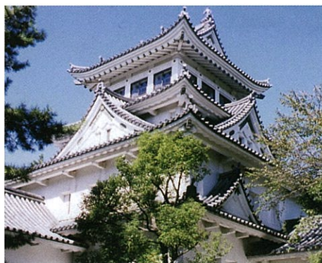
戦後再建された大垣城