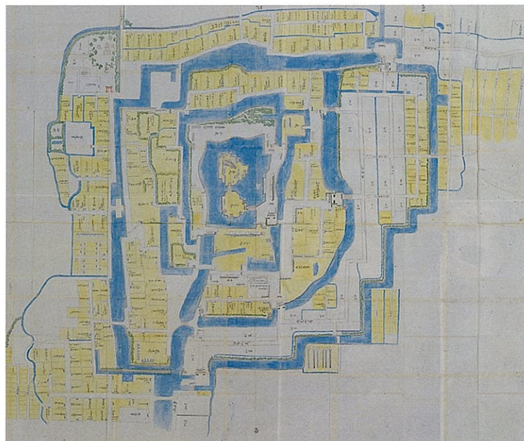
大垣城下図(寛永年間 大垣市立図書館蔵)

郷土大垣のシンボルといえる大垣城の歴史への理解と、郷土への関心を高めていただく機会となれば幸いです。