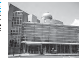
こどもサイエンスプラザ

●応募方法/6月18日~7月30日に、同事業団に備え付けの応募用紙に必要事項を記入し直接、同事業団(☎84-2000)へ