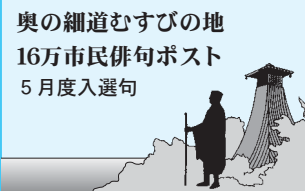
奥の細道むすびの地 16万市民俳句ポスト 5月度入選句