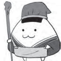
おむすび博マスコットキャラクター「むすぶくん」