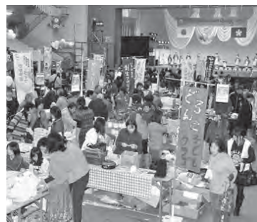
昨年の「秋のつどい」の様子