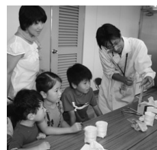
水質測定体験の様子(昨年)