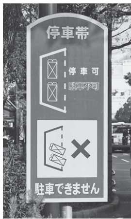
停車帯の標識(大垣駅通り)