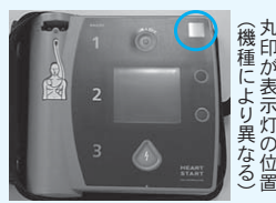
丸印が表示灯の位置(機種により異なる)

緊急時に備えて、AEDが正常かどうかを示す表示灯の確認や、使用期限があるバッテリーや電極パッドの交換を定期的に行いましょう。