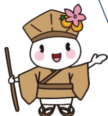
大垣市マスコットキャラクター おがっきい