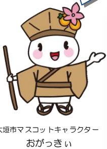
大垣市マスコットキャラクター おがっさい