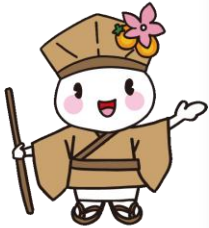
大垣市マスコットキャラクター おがっつきい