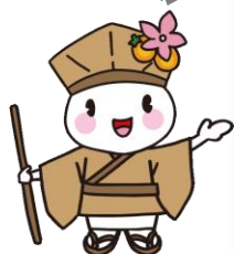
大垣市マスコットキャラクター おがっきい