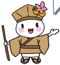
大垣市マスコットキャラクター おがっきい