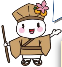
大垣市マスコットキャラクター おがっさい