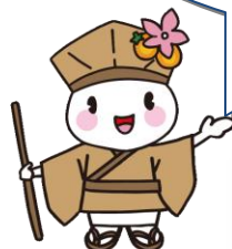
大垣市マスコットキャラクター おがっきい