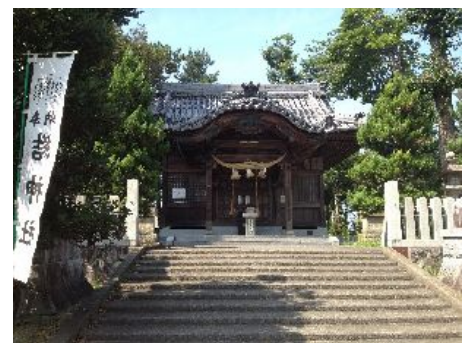
照手姫ゆかりの縁結びの地 (結神社)