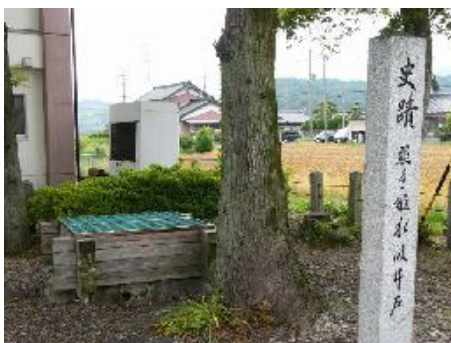
照手姫ゆかりの古井戸 (照手姫の水汲み井戸)