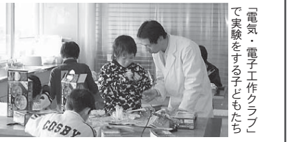
「電気・電子工作クラブ」で実験をする子どもたち

サイトピアホールで公開抽選 ▷受講料/3月29日までに、同課(北庁舎3階)へ持参 ※傷害保険料(800円)が別途必要。キャンセルしても、納入された受講料・保険料は返却されません ▷問合せ/同課(内線753・754)へ