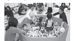
ボールプールで遊ぶ親子

親子でともに遊び、きずなを深める子育てサロン。未就園児を対象に、手遊び、体操、絵本の読み聞かせなどを楽しむことができます。ぜひお気軽にお越しください。利用時間は午前10時～正午(宇留生地区センターのみ午後2時～4時)。