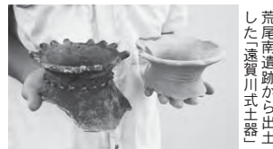
荒尾南遺跡から出土した縄文土器

*とき / 3月24日(日) 午後1時30分～4時 *ところ / サイトピアセンター スイトピアホール *内容 / 県文化財保護センターの藤田英博さんによる「ここまでわかった荒尾南遺跡」と題した報告、市教育委員会による市内発掘調査の報告 *問合せ / 文化振興課 (内線787) へ