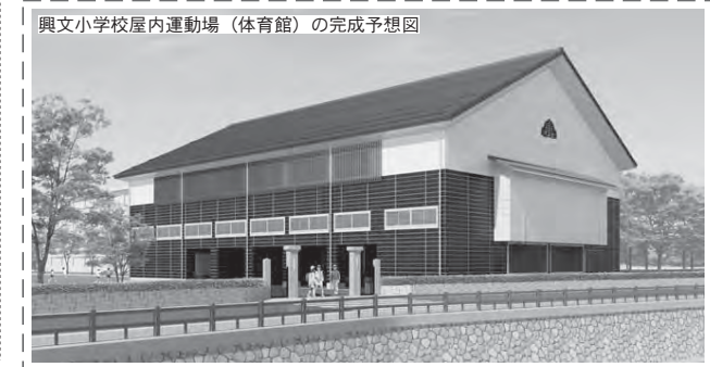
興文小学校屋内運動場(体育館)の完成予想図

なども考慮し、改築する ほか、防災行政無線整備事業/新庁舎建設基礎調査事業/自主防災組織支援事業/防災リーダー養成事業/安井保育園耐震補強事業/浸水対策事業/急傾斜地崩壊対策事業/民間建築物アスベスト対策事業など