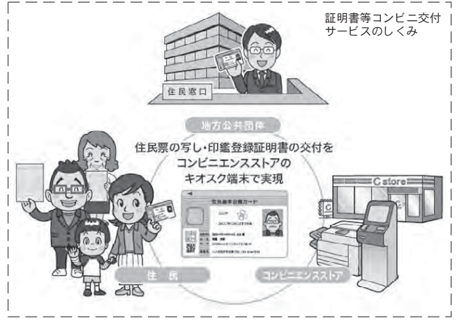
証明書等コンビニ交付サービスのしくみ

ほか、公共交通機関支援事業/企業立地支援事業/中小企業等金融対策事業/美濃路大垣宿本陣跡管理事業/未熟児養育医療費給付事業/市民病院託児所及び療養事業/墨俣第二水源改築事業など