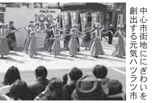
中心市街地に「にぎわい」を創出する元気ハツラツ市

ほか、おむすび博開催事業/大垣推奨土産品事業補助金/観光まちづくり調査研究事業/中心市街地商店街元気ハツラツ市事業補助金/城学連携まちなか再生事業/農業ビジョン推進事業/市営住宅長寿命化事業/北公園陸上競技場改修事業など