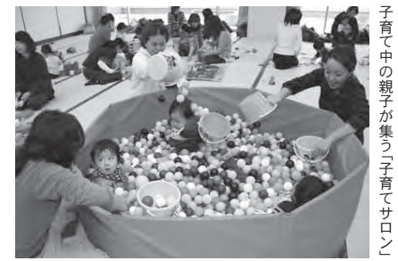
子育て中の親子が集う「子育てサロン」

◇子育て学習プログラム講座事業…子育て知識の向上を図るため、子育て中の母親を対象に、大垣女子短期大学で子育て講座を開催する