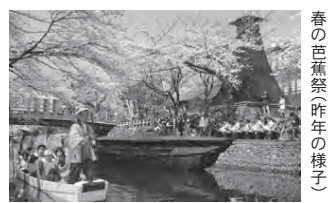
春の芭蕉祭(昨年の様子)

新年度予算は「地域活力創造」「安全・安心」「環境・エネルギー」「子育て日本一」「かがやきライフ」の5つの重点プロジェクトに、積極的に予算を配分。ここでは、新規事業を中心に重点プロジェクトの各事業を紹介します。