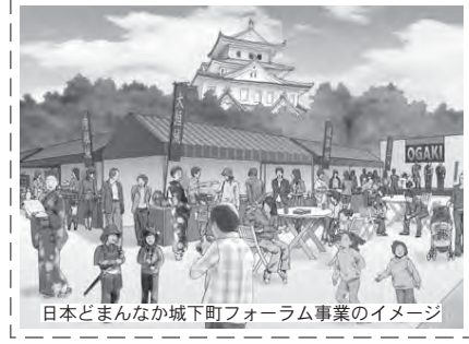
日本どまんなか城下町フォーラム事業のイメージ

◇日本どまんなか城下町フォーラム事業補助金…NEXCO 中日本（中日本高速道路株式