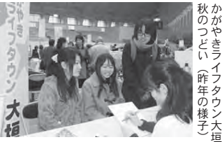
秋のつどい(昨年の様子) かがやきライフタウン大垣

◇ Mascot Character PR 事業…本市の知名度・イメージ向上を図るため、Mascot Character「おがっくん」を活用し、グッズ作成などのPR事業を進める