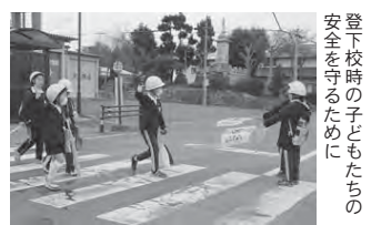
登下校時の子どもたちの安全を守るために

◇都市魅力PR推進事業…定住人口の確保を目的に、本市の子育てや福祉などの施策や事業