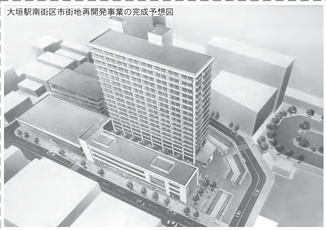
大垣駅南街区市街地再開発事業の完成予想図

◇中学校災害時避難誘導対策強化事業…災害時に的確な安全対応をとることができるよう情報伝達手段として有用なポータブルアンブを整備する