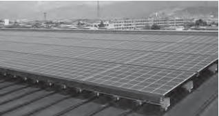
太陽光発電などの普及を促進

◇地下水利用地中熱ヒートポンプモデル設置事業補助金…地下水の熱エネルギーを利用した空調設備である地下水利用地中熱ヒートポンプ設備の設置に対し、設置費用の一部をモデル的に補助する