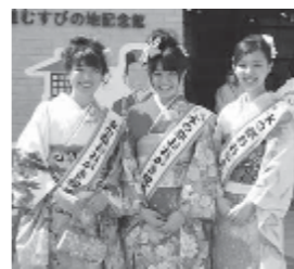
第5代・親善大使の皆さん