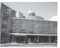
こどもサイエンスプラザ