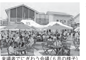
来場者でにぎわう会場(6月の様子)