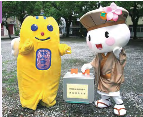
「明るい選挙推進運動イメージキャラクター」 「めいすいくん(左)と、「おがっきい」