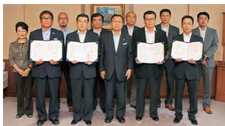
同協定の締結式(6月27日、市長室)

市は、6月27日、大規模災害時の一般廃棄物(し尿・浄化槽汚泥、一般ごみ、燃えないごみ)の収集・運搬にかかる無償救援協定を、新たに8団体と締結しました。