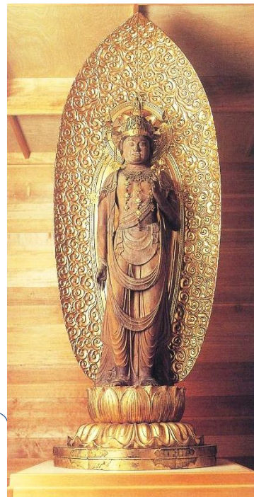
円興寺 木造聖観音立像

古墳についての講座によって、昼飯大塚古墳やこの地方の古墳、当時の様子などについて理解を深めた後、ツアー参加者だけの特別版葺石体験を実施。歴史再生の一員となって体験できます。