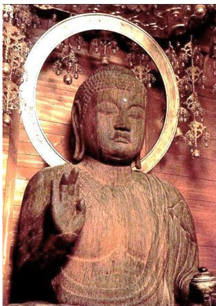
美濃国分寺 木造薬師如来坐像