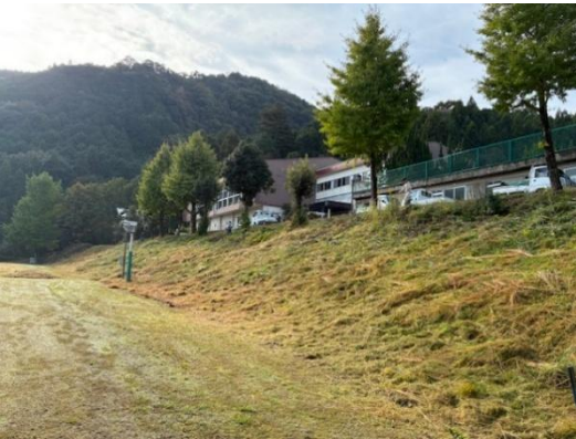
令和7年度 上石津学園校地内 環境整備(除草・剪定等)作業場所図