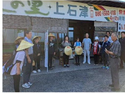
時地区での歓迎(朝市・えぼしの里)