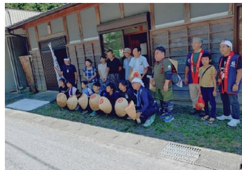
時地区での歓迎(時山集落内)