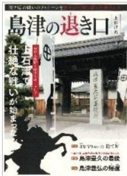
歴史探訪ツアー配布冊子 「島津の退き口・上石津説」