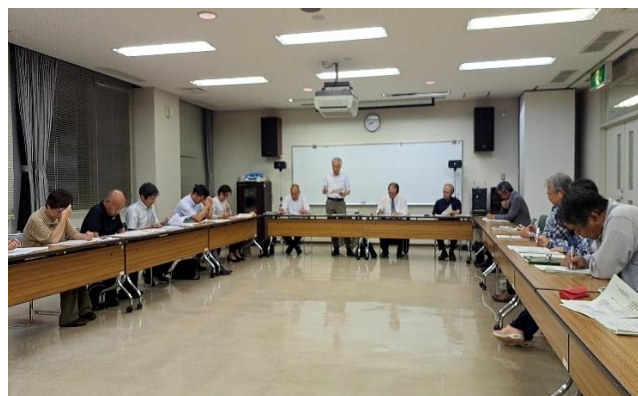
運営委員会の様子