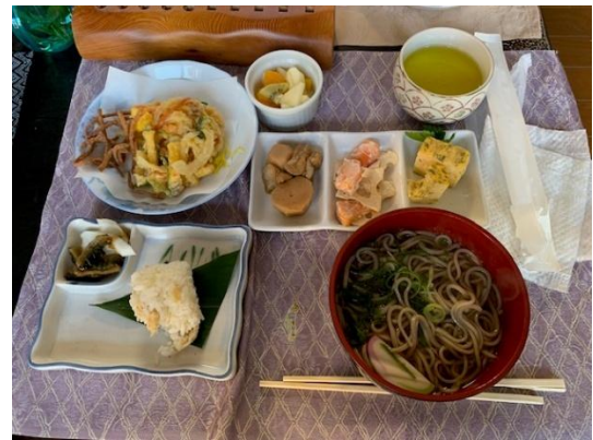
特製昼食「時そば御前」