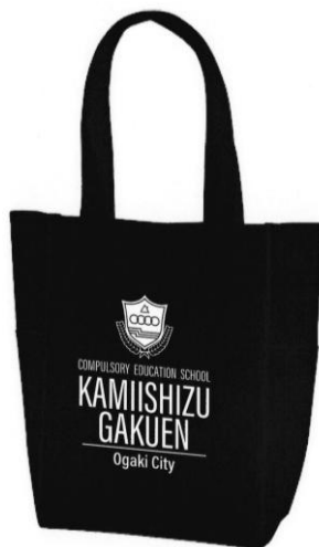
上石津学園オリジナルトートバッグ

贈呈日時 令和7年4月8日(火) 上石津学園入学式 贈呈対象 新1年生 31名 贈呈品 オリジナル上石津学園トートバッグ