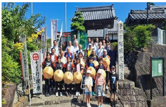
多良地区での歓迎(瑠璃光寺前)