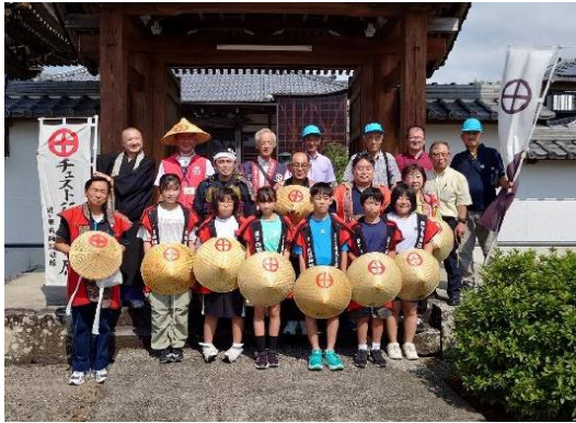
牧田地区での歓迎(琳光寺前)