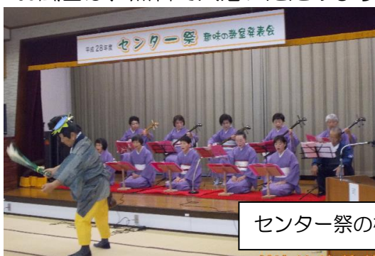
センター祭の様子